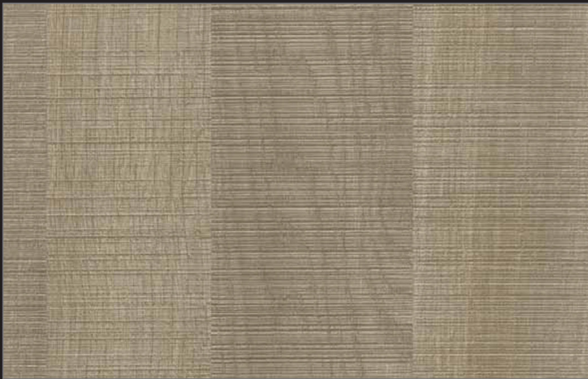
FPP - 002 - TY