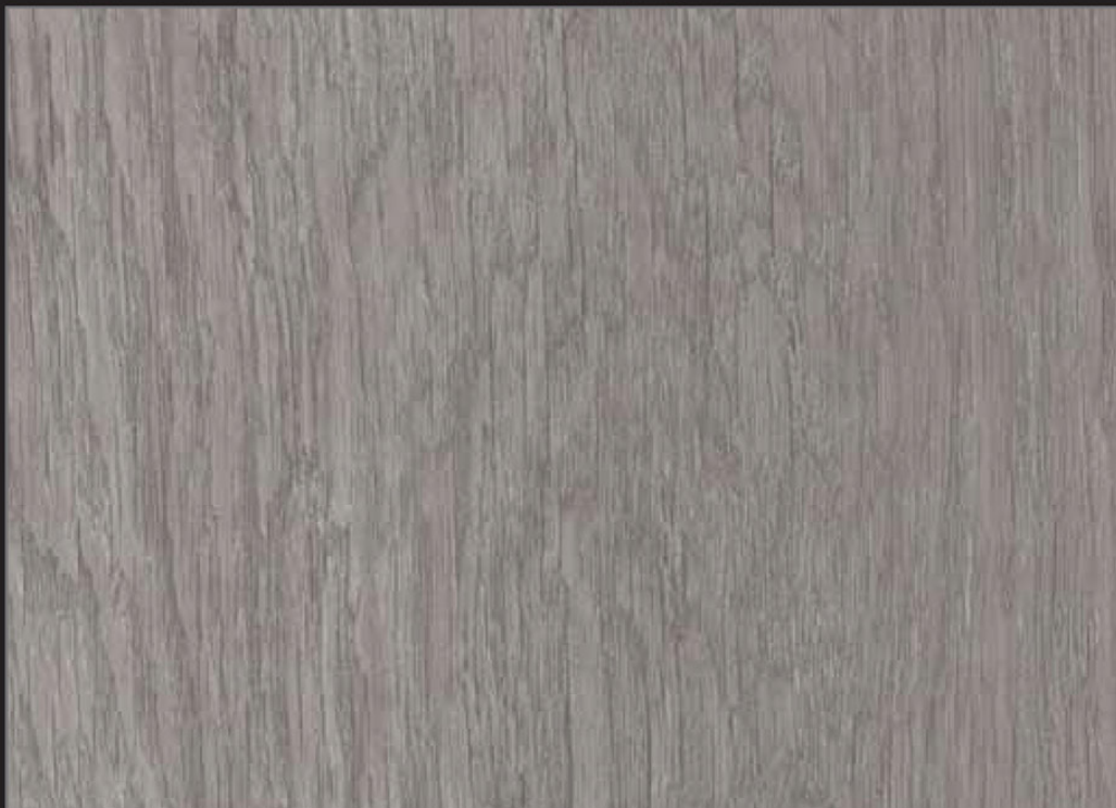
MU - 001 - URB