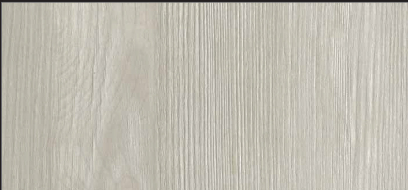
RT - IDA - 01