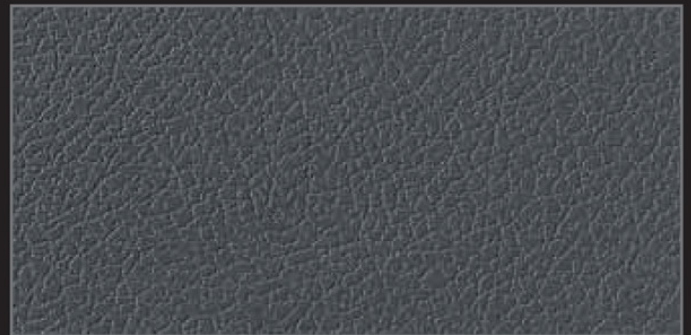
Leather dark grey