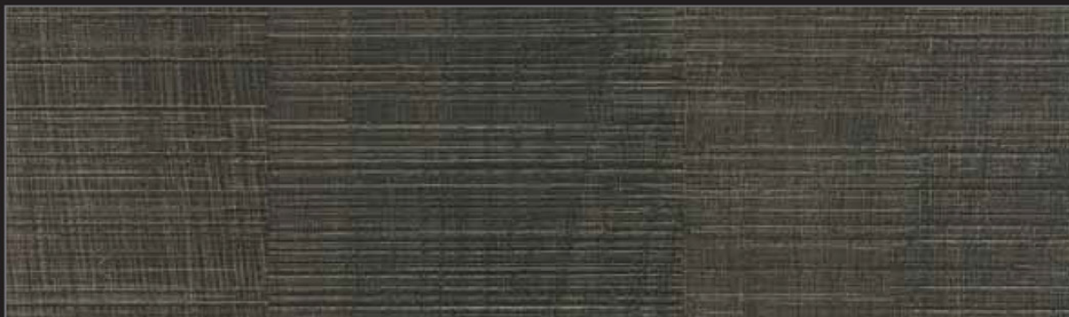
FPP - 003 - TY