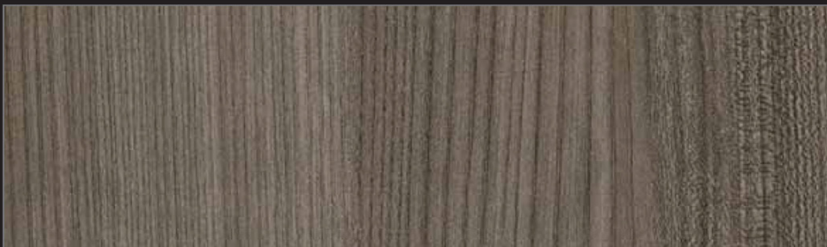
OLM - 002 - MR