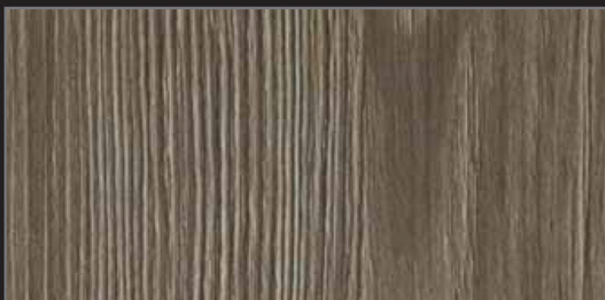
RT - IDA - 03