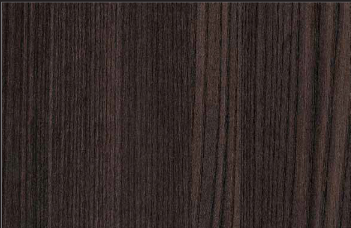
OLM - 003 - MR