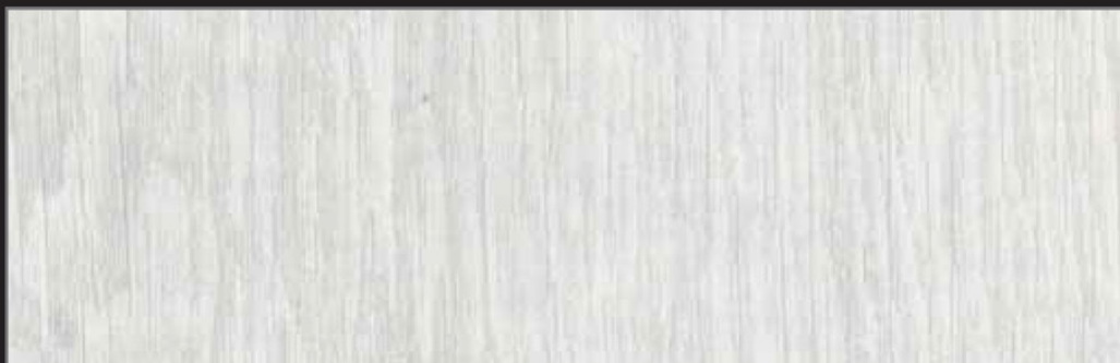
MU - 004 - URB